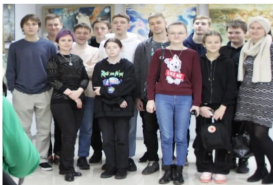
Красота в глазах смотрящего.

2 апреля в Беларуси и России ежегодно на государственном уровне отмечают День единения народов. Начало широкомасштабной интеграции Республики Беларусь и Российской Федерации как двух суверенных государств было положено 2 апреля 1996 года, когда Президент Беларуси Александр Лукашенко и Президент России Борис Ельцин подписали в Москве Договор об образовании Сообщества Беларуси и России, в соответствии с которым было решено создать политически и экономически интегрированное сообщество в целях объединения материального и интеллектуального потенциала двух государств. В декабре 1999 года после подписания соответствующего договора было создано Союзное государство. В его рамках страны постепенно реализуют инициативы по устойчивому социально-экономическому развитию государств, неоднократно продемонстрировавшие свою эффективность. К настоящему моменту Россия и Белоруссия заключили уже более 200 межгосударственных и межправительственных договоров и соглашений, а также многие соглашения о сотрудничестве связывают страны в рамках СНГ и ОДКБ. О знаменательной дате не забывают в обоих государствах — в честь Дня единения в Москве и Минске проходит целый ряд торжественных мероприятий. Зачастую по случаю торжества организуют концерты с участием артистов и коллективов из двух стран, разворачивают ярмарки с продукцией и сувенирами. Ко дню праздника приурочены конференции, посвященные интеграции союзных государств, с участием политиков, юристов и дипломатов.